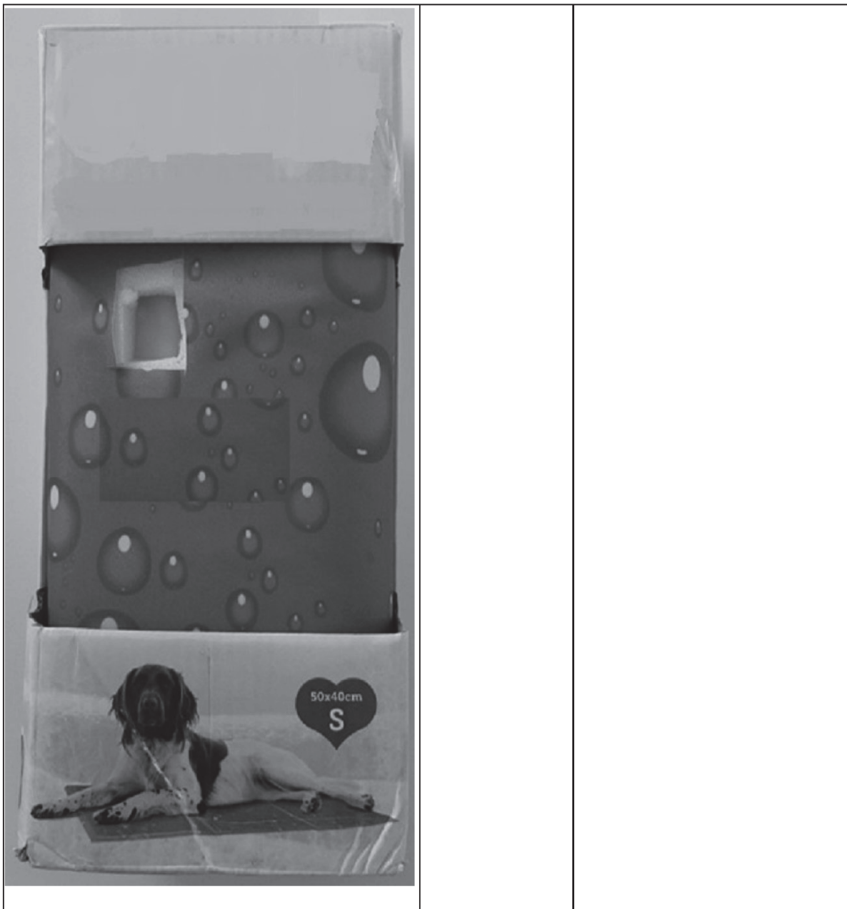
(*) Фотографијата е само од информативен карактер